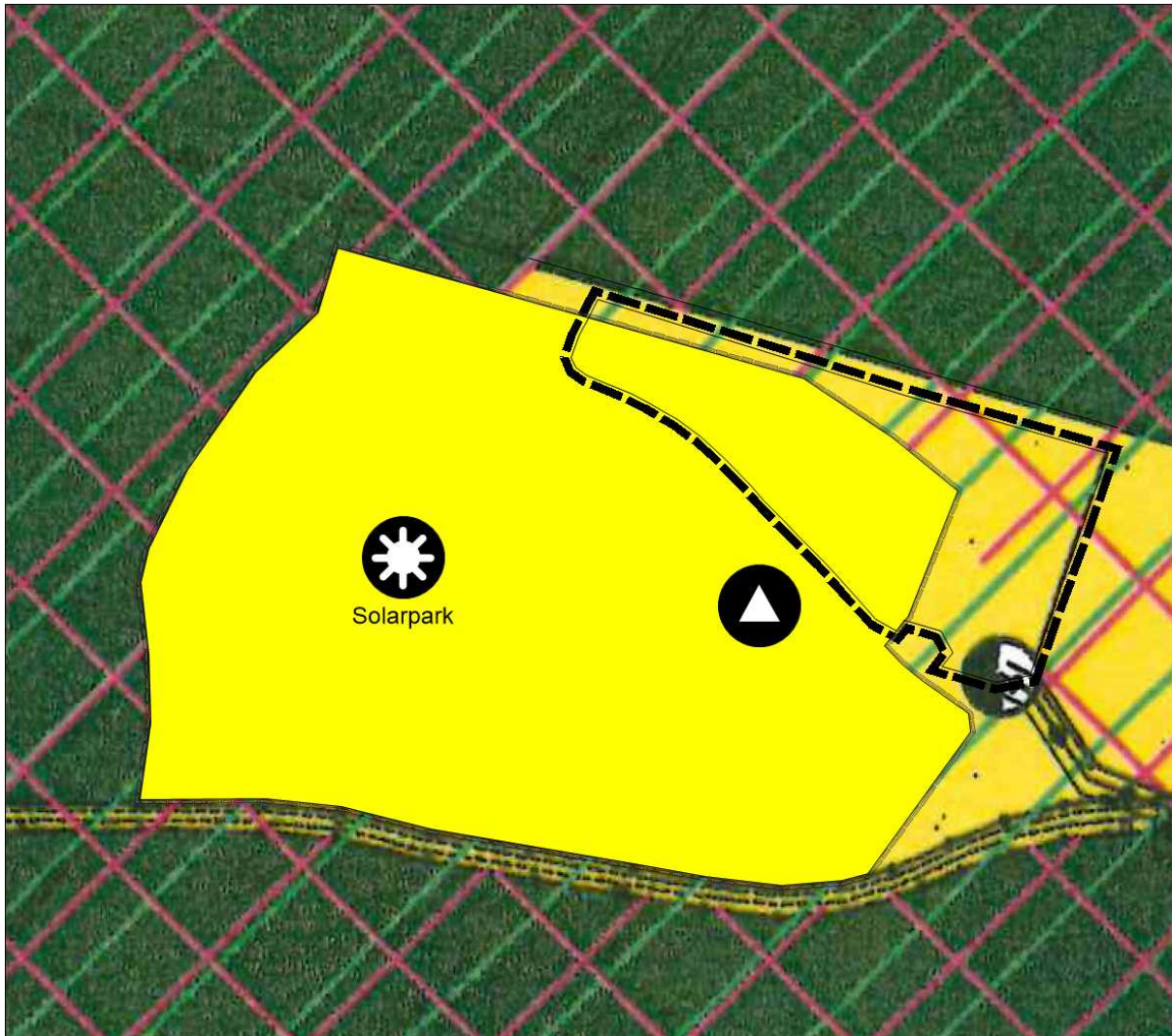
Abb. 3: Ausschnitt aus dem Flächennutzungsplan Weiherhammer 1. Änderung.

Der geltende Flächennutzungsplan weist im Geltungsbereich überwiegend „Flächen für Versorgungsanlagen, Abfallentsorgung, Abwasserbeseitigung und Ablagerungen“ mit der Zweckbestimmung „Abfall“ und „Solarpark“ aus. Weiterhin liegen die Signaturen „Landschaftsschutzgebiet“ teilweise und „Vorbehaltsgebiet für Aufschüttungen und Abgrabungen“ vollständig über der Deponiefläche. Diese nicht mehr aktuellen nachrichtlichen Darstellungen im FNP wurden mit der 1. Änderung des FNP redaktionell berichtigt. Die Vorgaben des Flächennutzungsplans stehen der Planung daher nicht entgegen.